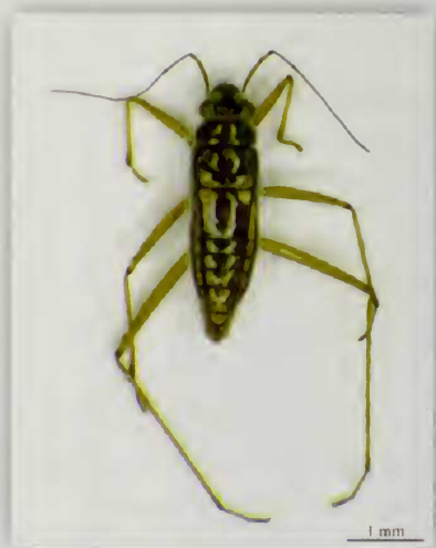
Fig. 6.- Habitus de Mesovelia vittigera H. (♂)

Material estudiado: La Palma: ■ San José, Breña Baja, 256 m, 28RBS2872, 20/IX/1992, 2 exx., R. García, leg. ■ La Grama, Breña Alta, 270 m, 28RBS2874, 15/XII/1996, 2 exx., R. García, leg. ■ Bco. de Las Angustias, El Paso, 210 m, 28RBS1576, 12/V/1999, 2 exx., 08/IX/2009, 3 exx. (R. García, leg.) ■ El Pocito, Mazo, 60 m, 28RBS3065, 08/XII/1999, 2 exx., R. García, leg. ■ Los Callejones, Mazo, 193 m, 28RBS2967, 13/VI/2000, 1 ex., R. García, leg. ■ Siete Fuentes, Breña Alta, 1810 m, 28RBS2380, 08/VIII/2001, 1 ex., R. García, leg. ■ Botazo, Breña Alta, 580 m, 28RBS2674, 29/XI/2006, 1 ex., R. García, leg.